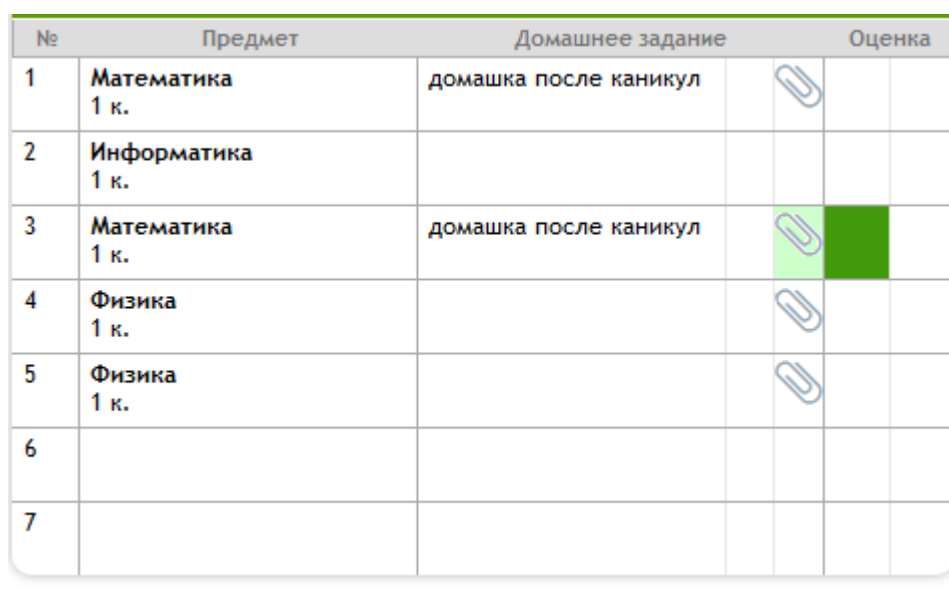
Рисунок 1 – Дневник ученика