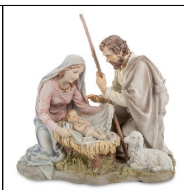
Б) Рождество Христово